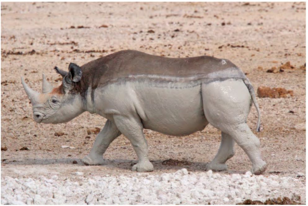
SALE DE BAIN