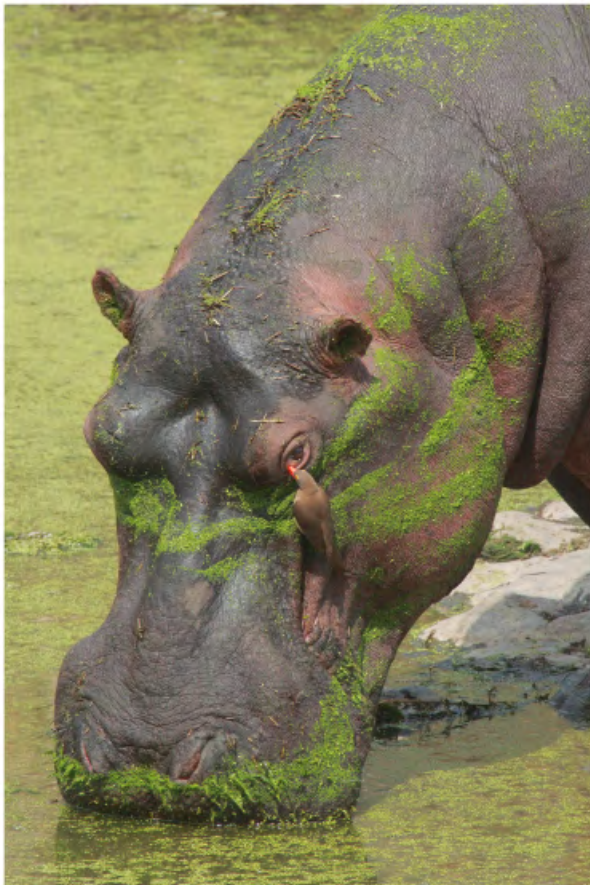
NETTOYAGE A L'ŒIL